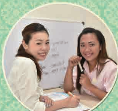
マンツーマン授業