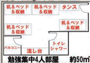
勉強集中4人部屋 約50㎡

トイレ付シャワールームがあるスタジオ(ワンルーム)タイプのユニットに、机と一体型のベッド(したに机、階段上にベッド)が4台あります。