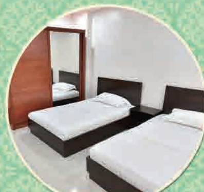
ハイレベルな設備